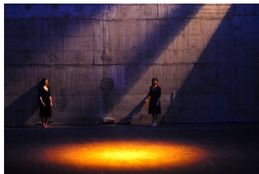
Elles-Alphabet - Mise en scène Didier Bernard

1998 à 2001 : Chargé de cours « Langage Théâtre » UFR STAPS (université Claude Bernard de Lyon). 2026: ateliers FLE Language theatre Université Humboldt, Berlin