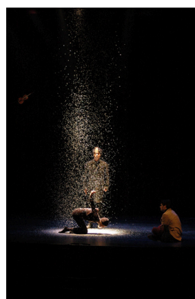
Le Jeune prince et la vérité - Mise en scène Didier Bernard